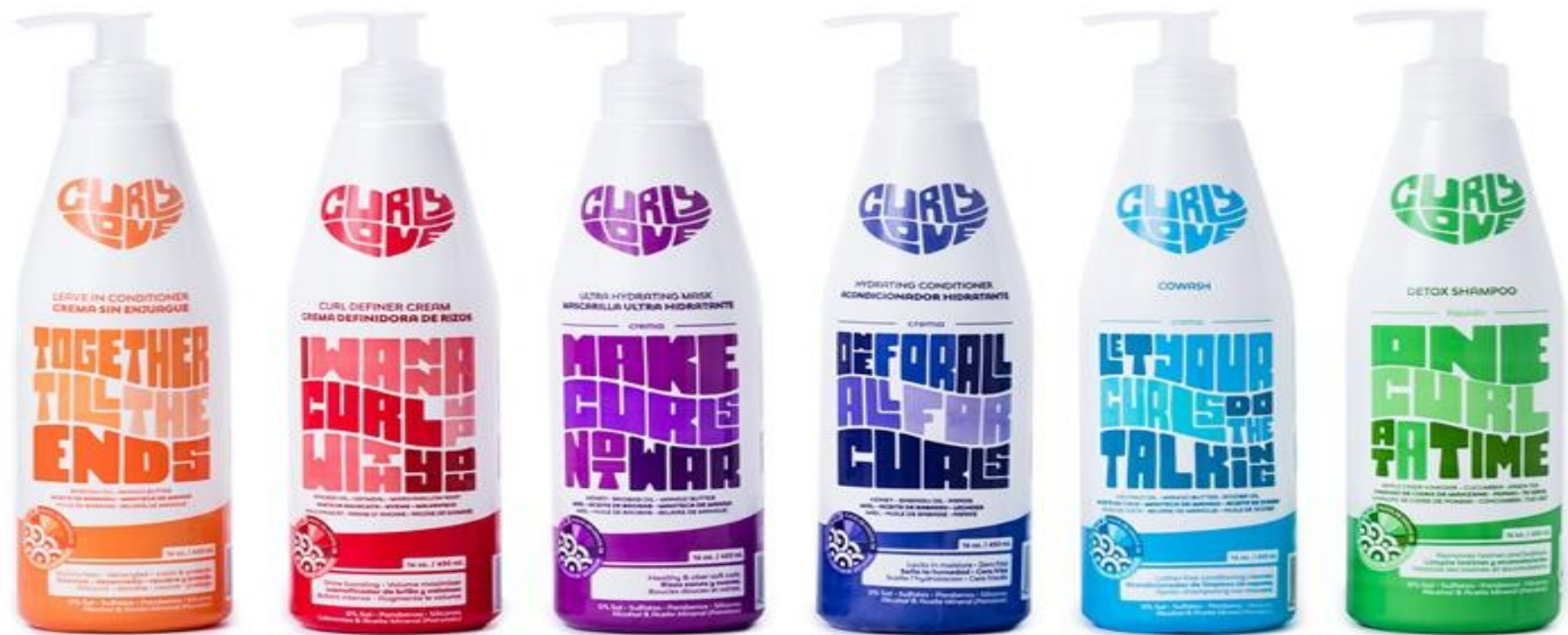
Familia De Productos